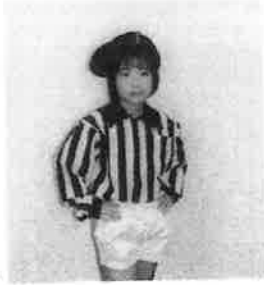
オフサイド(守備側)