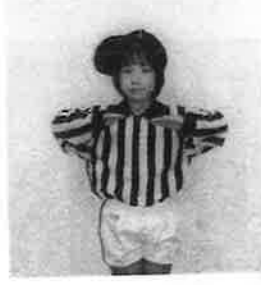
不正なシフト(両手)、不正なモーション(片手)